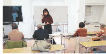
使い方教室での一コマ (上)テラスモール湘南 (下)藤沢店