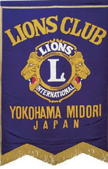
同クラブのクラブ旗