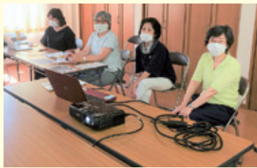
▲師岡町会館で進行を見守る地域のみなさん

先日は楽しい時間をありがとうございました。子ども達も自粛でストレスが溜まってきて元気がなかったところ、本当に楽しそうに画面に向かっていました。このような機会をいただけましたこと、感謝申し上げます。