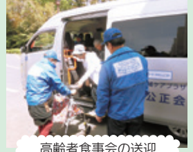
高齢者食事会の送迎

空いている車両を利用したサロンの送迎、介護予防の講師、会場の貸し出しなど社会福祉法人や施設が行う地域貢献の取組「泉サポートプロジェクト」を支援します。