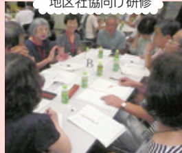
地区社協向け研修

子ども、障がいのある方、高齢者などすべての人が地域のなかでより多くの人と交流できるよう支援します。「一人ひとりの困りごとを解決できる地域づくり」を地区社協と進めます。