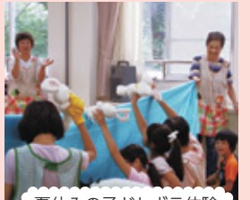
夏休みの子どもボラ体験

子ども、障がいのある方、高齢者などすべての人が地域のなかでより多くの人と交流できるよう支援します。「一人ひとりの困りごとを解決できる地域づくり」を地区社協と進めます。