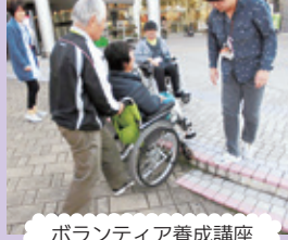
ボランティア養成講座

地域活動の担い手を養成するため、関係機関と協働しながらボランティア講座や活動紹介を行います。広報活動を通して、地域や福祉保健活動に関する情報を発信します。