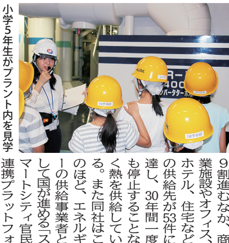
小学5年生がプラント内を見学 連携プラントフォ

MM地区は、1965年に構想発表された横浜 市六大事業の1つ、都心 部強化事業の中核的位 置で開発された。同社 はその街づくりの一翼を 担い、先進的な都市施設 に熱供給を行う企業とし て、現在MM地区の開発が 9割進むなか、商 業施設やオフィス、 ホテル、住宅など の供給先が53件に 達し、30年間一度 も停止することな く熱を供給してい る。また同社はこ のほど、エネルギー の供給事業者とし て国が進める「ス マートシティ官民