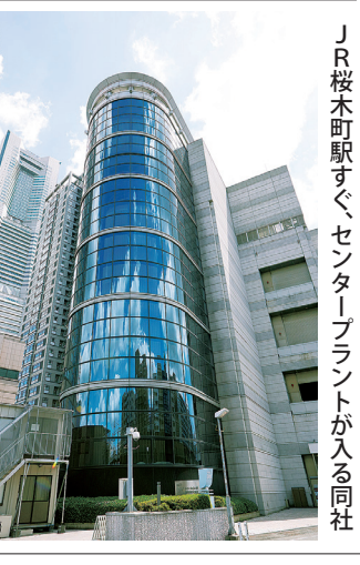
JR桜木町駅すぐ、センタープラントが入る同社

「MIRAI」へ 同社は、18年に「2030ビジョン」を策定した。スローガンは「CHALLENGE to the MIRAI」。社員への公募によって決めた。