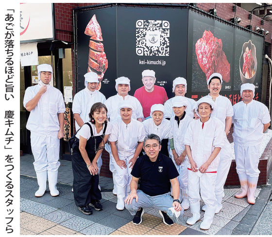
「あごが落ちるほど旨い 慶キムチ」をつくるスタッフら

「健康で美味しいライイキムチにする。多摩区のフスタイルの追求」をコンセプトに、こだわり農家の旬の野菜を使用し、つくりあげる慶キムチ。最近では「産地地酒」にも力を注ぎ、神奈川県、川崎市産の名物野菜を使用し、鮮な食材を市民に提供できるメリットがある。近