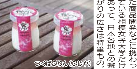
つばぶりん(ふじや)