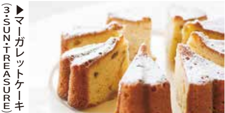
マーガレットケーキ SUN-TREASURE

みどころ① 相生祭において、来場者の方々のリピーター率No.1かもしれないのが「地域物産展」。全国各地の新鮮で旬のものが一堂に並ぶとあって、行列がでるブースも少なくありません。