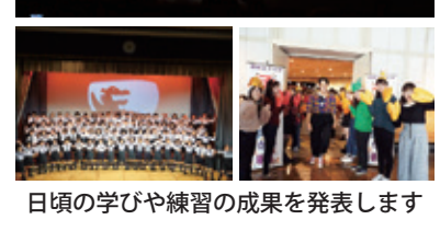
日頃の学びや練習の成果を発表します

POINT3 学園の雰囲気味わえる? 見所満載ステージ企画 グラウンドでは、3日4日とも様々なステージイベントが企画されています。ダンスクラブや軽音楽部、ASTERや舞踏研究部、アイドル研究同好会などが出演。高等部のチアリーディング部や軽音楽部もステージを盛り上げます。また、幼稚部、小学部鼓笛隊、中学部・高等部バトン部と吹奏楽部が出演するグラウンドドリルも必見。3日10時15分スタートです。