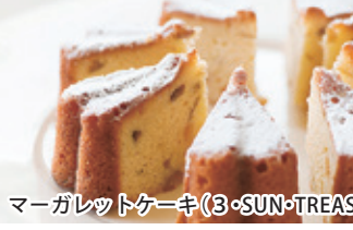
マーガレットケーキ(3・SUN・TREASURE)