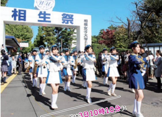
市パレードは3日10時10分に 大学グラウンドを出発し、 相模大野駅で折り返します

相生祭と言えば「市中パレード」！大学の吹奏楽部はもちろん、小学部のかわいらしい鼓笛隊や、全国大会出場経験のある中学部・高等部のバトン部と吹奏楽部も参加します。年齢や学部を飛び越えてのパレードは「総合学園」ならではの、グラウンドと相模大野駅周辺を往復しますので、ぜひ、大きな声で応援してくださいね。