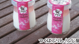
つばぷりん(ふじ屋)