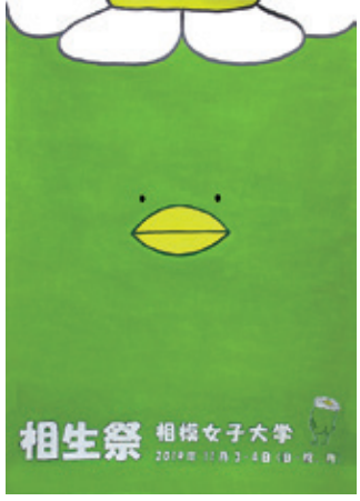
今年のポスターはコレ!

今年もやります、ミスマーガレットコンテスト! エントリーした学生のなかから、来場者の皆さんの投票でナンバー1が決定します。アピールタイムもあり、毎年ドキドキが止まりません。ミスマーガレットに輝いた学生には旅行券のプレゼントも。投票お待ちしています! アピールタイム 3日11時15分～ 4日11時10分～ 結果発表 4日13時50分～ 投票場所 本部テント