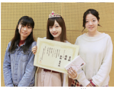
昨年のコンテストの様子