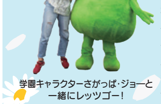
学園キャラクターさがっば・ジョーと一緒にレッツゴー!

POINT3 学園の雰囲気味わえる? 見所満載ステージ企画 グラウンドでは、3日4日とも様々なステージイベントが企画されています。ダンスクラブや軽音楽部、ASTERや舞踏研究部、アイドル研究同好会などが出演。高等部のチアリーディング部や軽音楽部もステージを盛り上げます。また、幼稚部、小学部鼓笛隊、中学部・高等部バトン部と吹奏楽部が出演するグラウンドドリルも必見。3日10時15分スタートです。