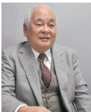
八王子市商店会連合会会長／三多摩商店街連合会会長／東京都商店街連合会副会長