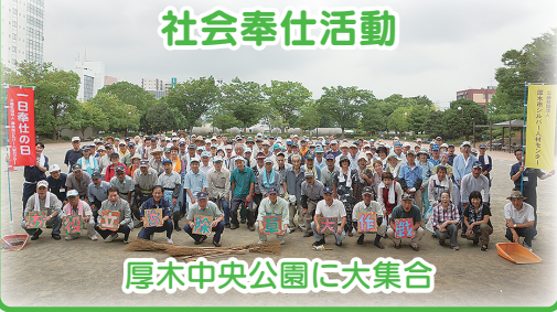
厚木中央公園に大集合